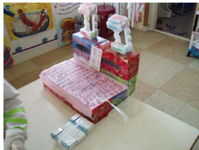
孩子製作了一部電腦，記錄病人的生病情形。仔細看看，鍵盤上的數字有沒有按順序排列呀？