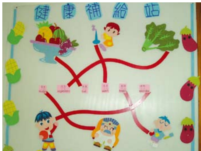
主題相關的文圖配對

主題進行前老師會事先布置主題情境，提供探索的學習環境，當孩子看到環境中充滿著美語的文字後，好奇的問老師：「老師，那教室的門也要寫英文啊！」「還有電話也要寫啊！」於是，老師提供紙筆讓幼兒進行仿寫的工作。