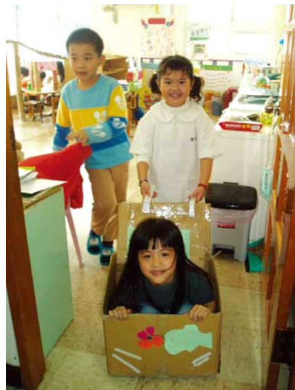
孩子製作輪椅，讓有需要的病人使用它。