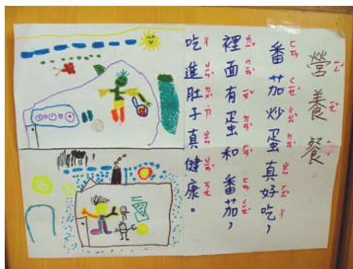
我們班創作的營養歌。

有了健康食物及營養餐的學習經驗，為了製作好吃的營養餐，老師與孩子針對營養餐的內容進行討論，並分配工作。