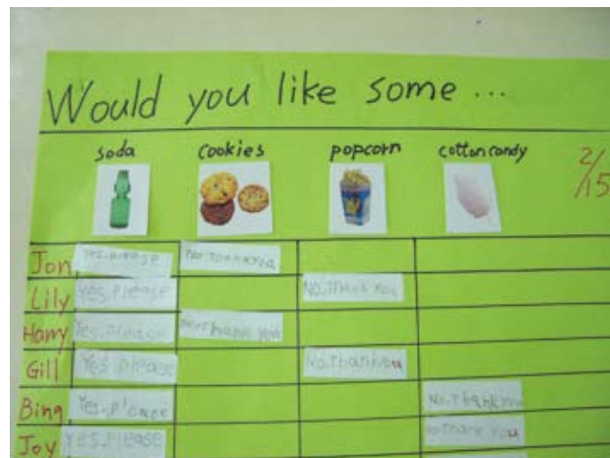
"Would you like some..." 的經驗圖表