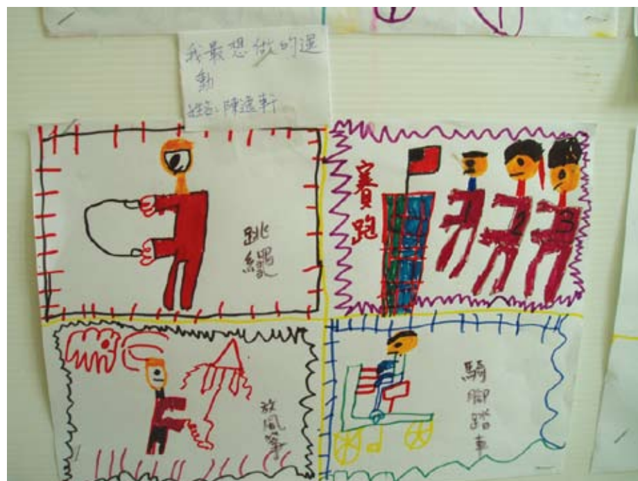
逸軒最想做運動是跳繩、賽跑、放風箏，還有騎腳踏車。

有孩子提出除了吃營養餐，運動也會幫助身體健康。老師請孩子分享運動對身體的幫助，並邀請孩子畫下自己最想做運動。