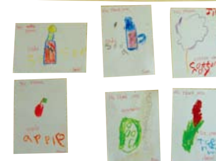
美語的句型卡及幼兒自製的字卡

Would you like some _____ ? No, thank you.