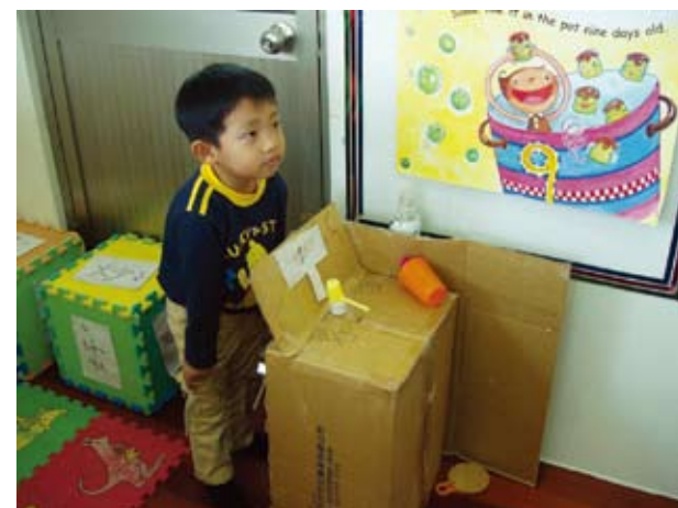
這是本店的特製廁所，使用起來感覺不錯吧！