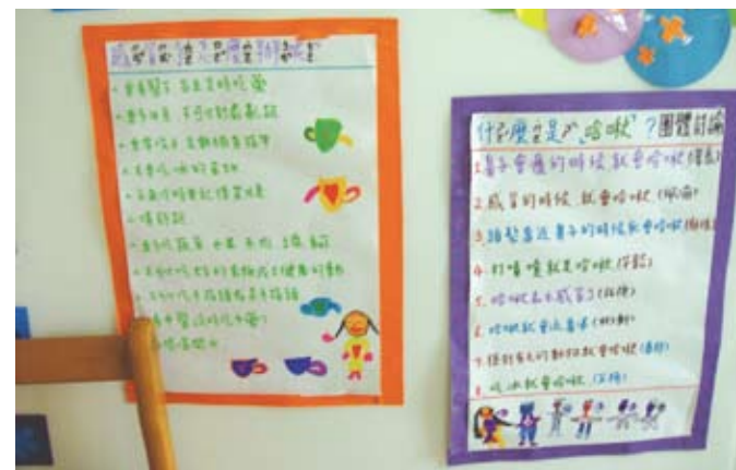
老師透過分享及討論，導入健康的話題