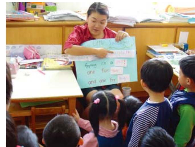
兒歌創作的成果分享

幼師與孩子進行 "Two Little Sausages" 的語詞替換活動，並張貼到語文角，2~3位孩子在角落時間會相偕到語文角，考考對方是否能唱出改編的兒歌呵！透過活動提升孩子口說能力，也豐富了美語的單字。