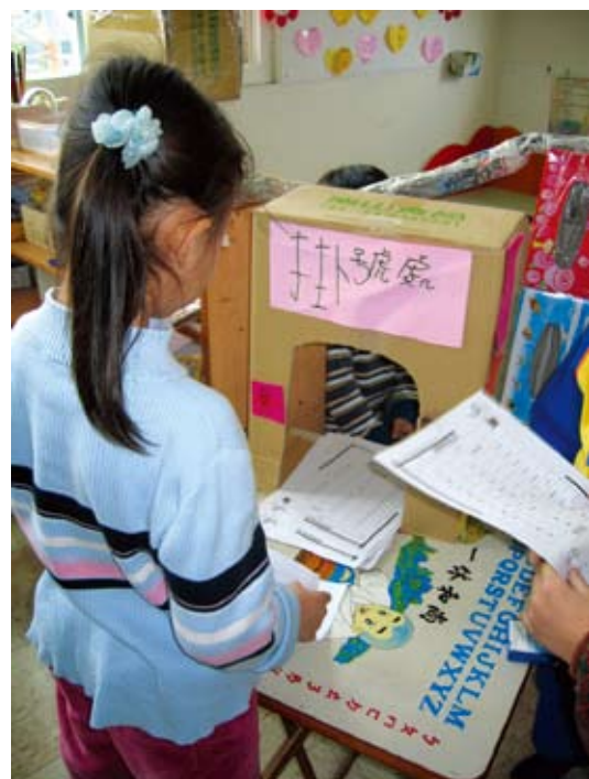
健康檢查前要先掛號呵！