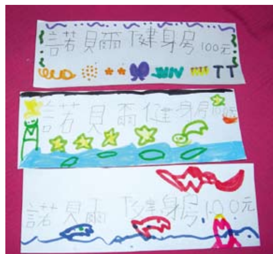
進入健身房是必須給票的，所以孩子製作了許多面額100元的門票！

孩子以分組的分式熱烈展開一系列製作有關健身房設備的活動，有跑步機、仰臥起坐機，還有擴胸機呵！