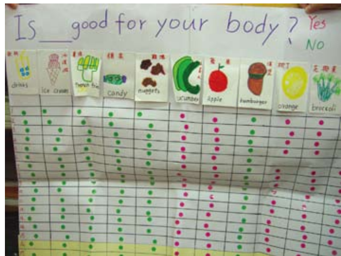
"Is _____ good for your body?" 的經驗圖表

美語時間結束後，幼師將課堂上的美語句型寫在紙上並張貼在布告欄，孩子喜歡在布告欄前做一問一答的遊戲呵！有的則做經驗圖表，讓孩子仿寫 "Yes, please." "No, thank you." 後貼在自己想吃的食物上，並做口語練習。