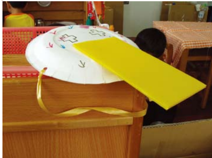
看我們做的廚師帽，很帥吧！