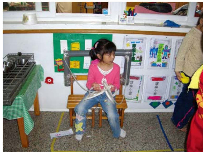
利用擴胸機，做做擴胸運動。