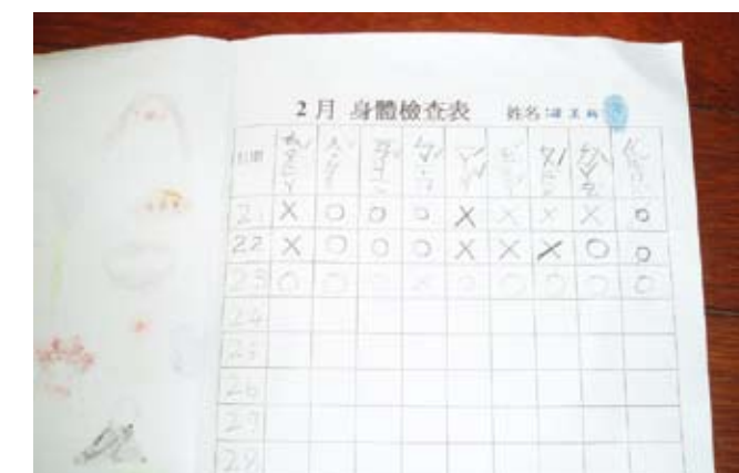
孩子製作的「身體檢查表」，檢查的項目包括：頭髮、耳朵、眼睛等。