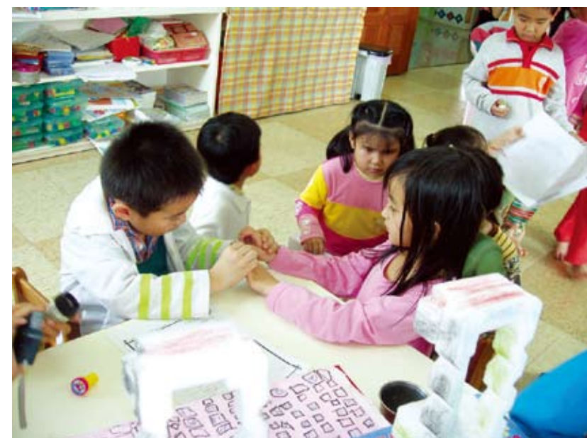
檢查一下指甲乾不乾淨！