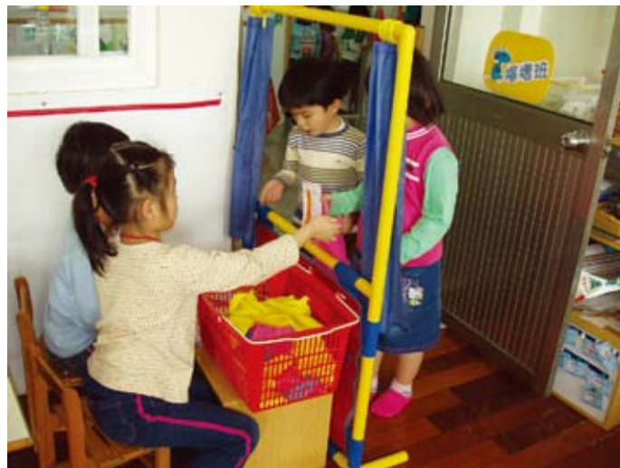
先生，請先買票，一張100元。