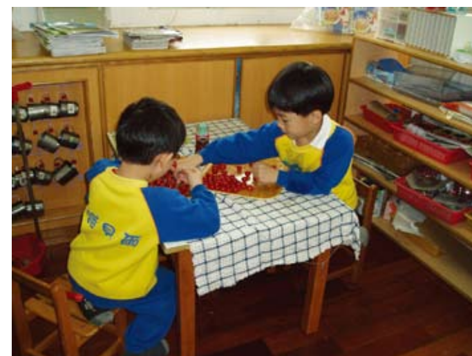
我們負責處理水果。