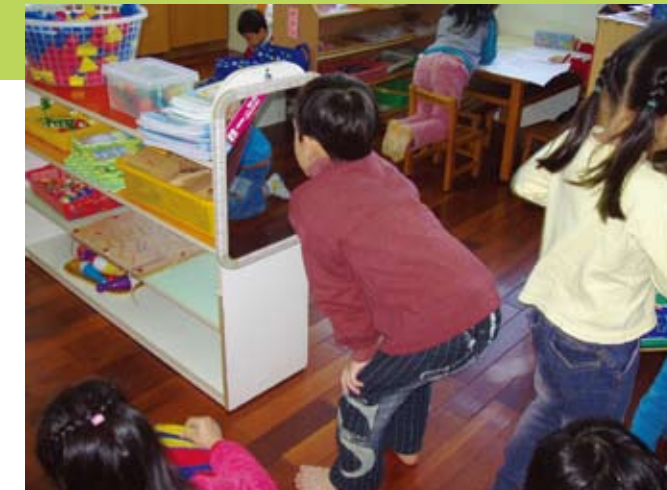
孩子每天依據身體檢查的注意事項，將檢查的結果記錄在「身體檢查表」上，也建立了對日期與時間的概念。