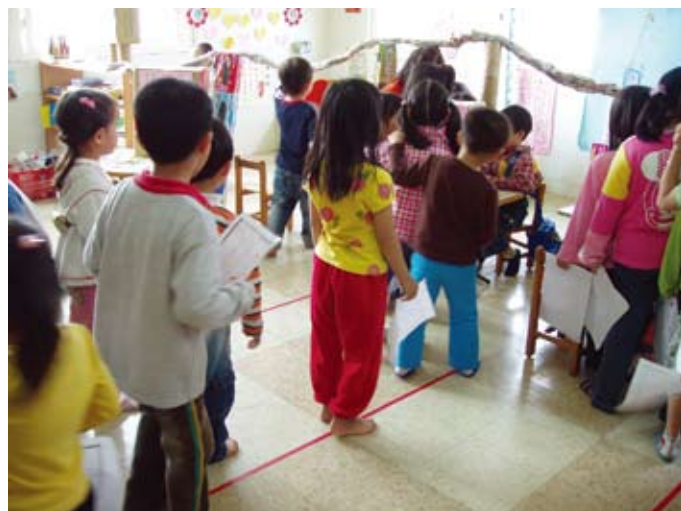
春風小兒科要舉辦全園的健康檢查，一開門就有許多人在排隊嘍！