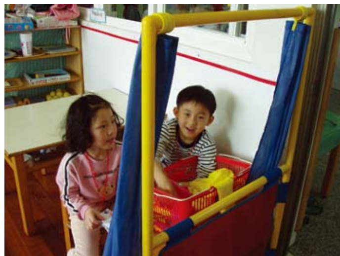
在教室門口孩子規劃了入口處。