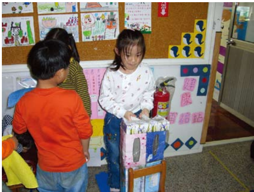
在跑步機上，你能跑多久呢？