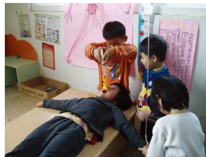
這位病人需要打點滴，而且還要口服一種特效藥呵！