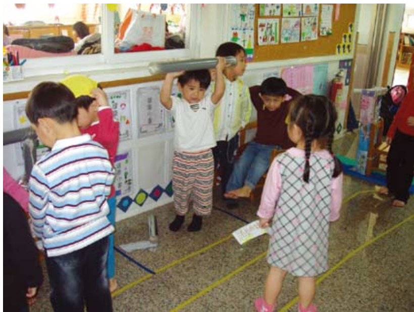
舉重可不是一件輕鬆的事呵！