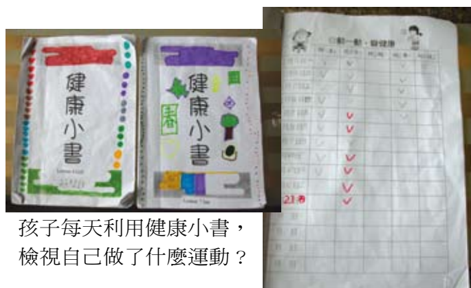
孩子每天利用健康小書，檢視自己做了什麼運動？