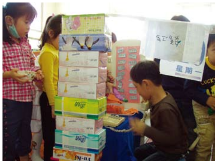
今天的人太多了，請大家善用預約電話訂位。