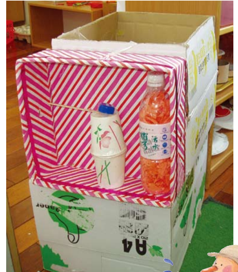
有了特製的滅火器，火災不用怕。