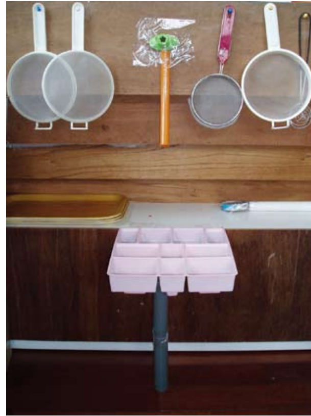
孩子透過觀察和討論後，決定製作一枝水管，是不是運用了很棒的物理概念呢！