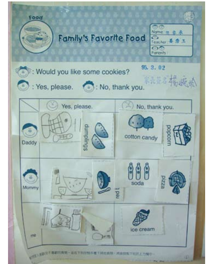
Family's Favorite Food 的學習單

當諾貝爾以「融入式」的教學方式，將美語帶入幼兒的學習世界時，不但連結了各領域的學習經驗，也提升了美語運用及理解的能力，也因此創造出會說話的語言環境，讓中英文彼此交織出語言的連結網，使幼師更積極投入美語的學習環境，並與幼兒一同經歷了一段自然、真實及有意義的美語學習歷程。