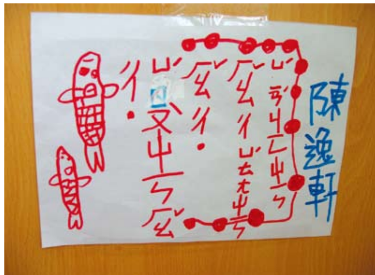
為了推銷餐廳的食物，所以製作了一張宣傳單。