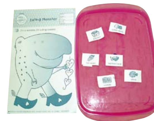
利用學習單製成的美語教具

Would you like some _____ ? No, thank you.