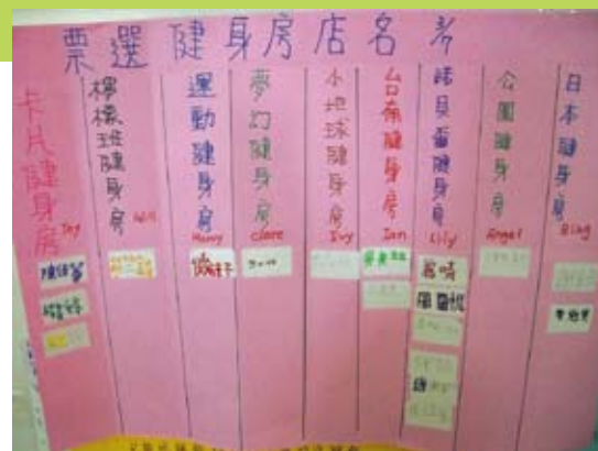
孩子以投票的方式決定健身房的名字。