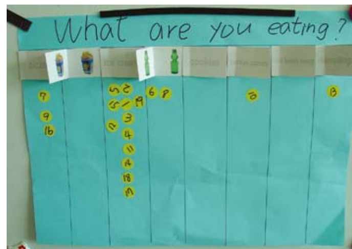
票選活動：孩子記錄班上同學喜歡吃的食物。