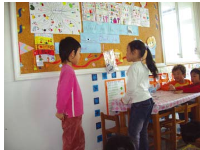
幼兒在布告欄前，進行一問一答的遊戲

美語時間結束後，幼師將課堂上的美語句型寫在紙上並張貼在布告欄，孩子喜歡在布告欄前做一問一答的遊戲呵！有的則做經驗圖表，讓孩子仿寫 "Yes, please." "No, thank you." 後貼在自己想吃的食物上，並做口語練習。