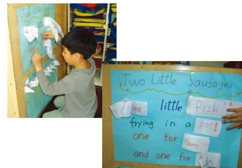
到語文角念唱我們創作的兒歌呵！