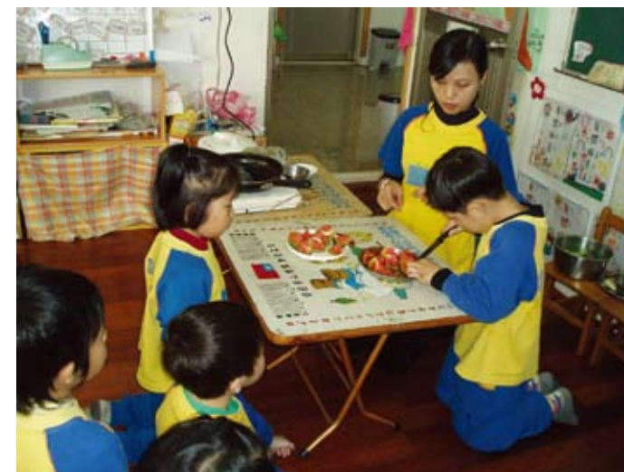
切切番茄，做一盤番茄炒蛋嘍！

接著昨天的活動，今天開始分組製作營養餐的烹飪活動，從清洗到烹調，皆由孩子負責，老師則在一旁協助。在大家的分工合作下，營養餐終於完成了，大家迫不及待的想嘗嘗看，最後把全部的食物都吃光光，臉上掛著微笑、滿足的說著：「好好吃呵！」