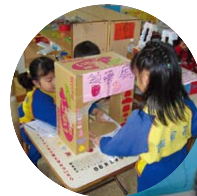
配合醫生的處方籤，藥師開始配藥，病人再到領藥處取藥呵！