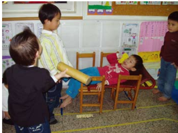
看我做仰臥起坐的樣子，很厲害吧！