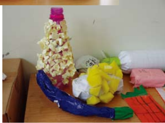
孩子到美勞區運用各種素材開始製作食物。