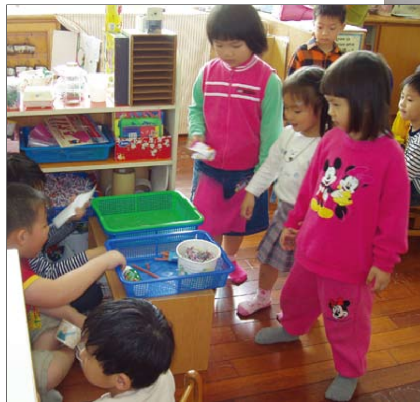
點個餐，補充一下體力。