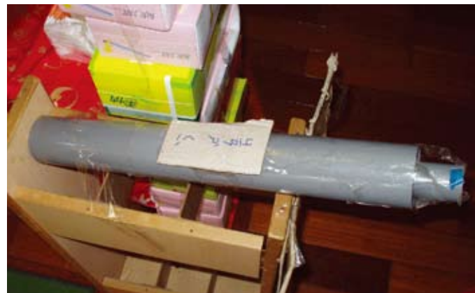
看我們運用水管製作的超大監視器。科技的運用無所不在喔！