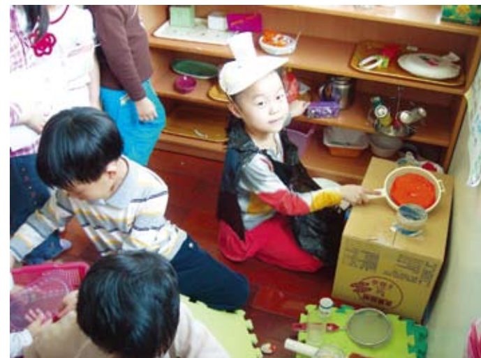
大家好，我是本店的主廚，我做的餐點可是營養又衛生呵！