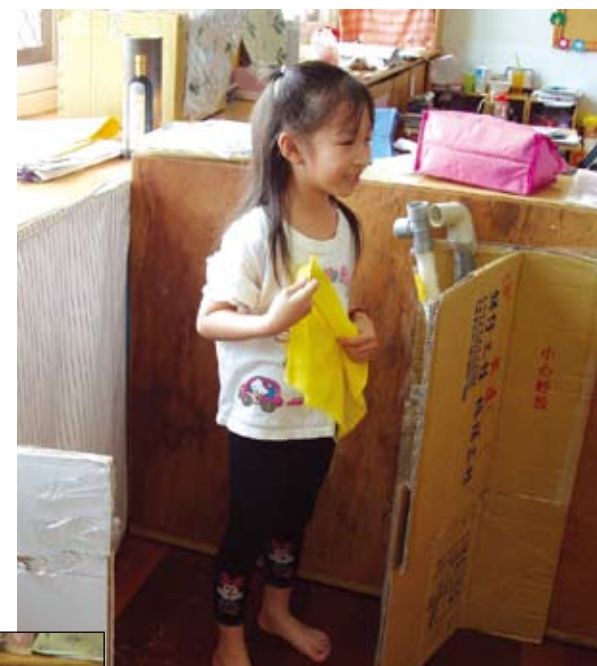
運動過後沖沖澡，真舒服！