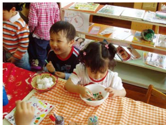
水果營養餐廳的餐點真的好好吃！