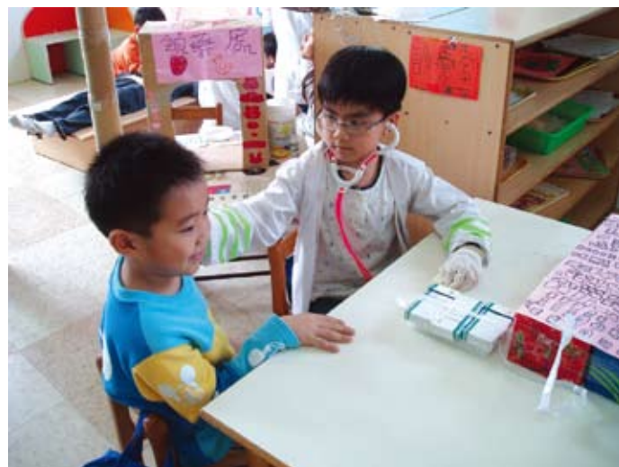
到診療室看病，醫生可是很認真的看病呵！