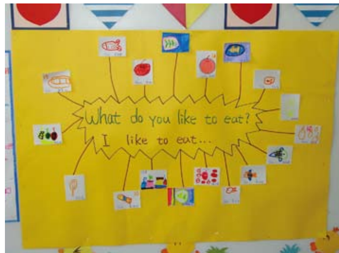
經驗圖表：由孩子的經驗延伸句型的運用。

幼師會運用團討時間、學習區、經驗圖表、票選活動或活動字卡，統整孩子在美語時間所習得的句型及單字。