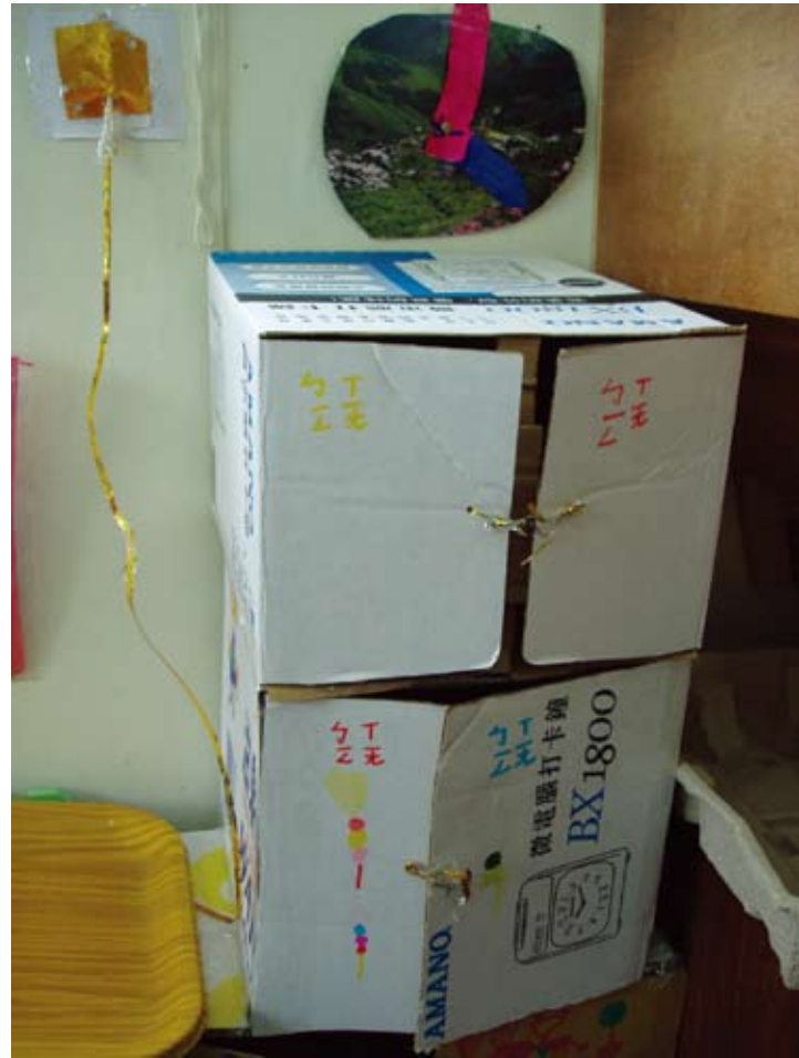
特製冰箱出爐，我們還有做電線及插座呵！科學的概念，無形中在建構活動中建立了。