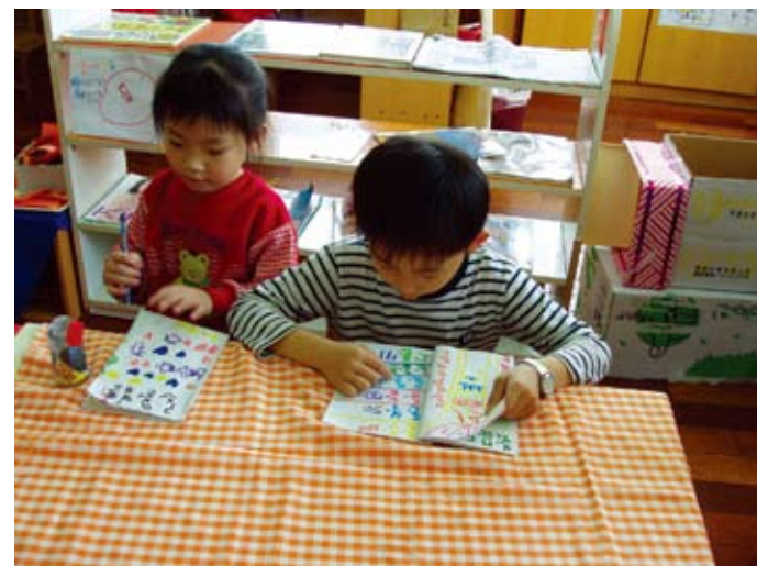
讓我看看今天要點什麼餐？