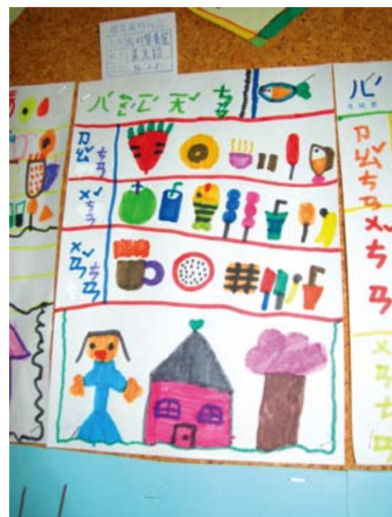
孩子們用色筆畫下早、中、晚的兒童營養餐