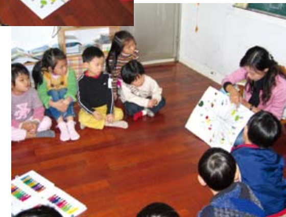
孩子畫下自己認為的「健康食物」，老師再請孩子分享自己的想法。